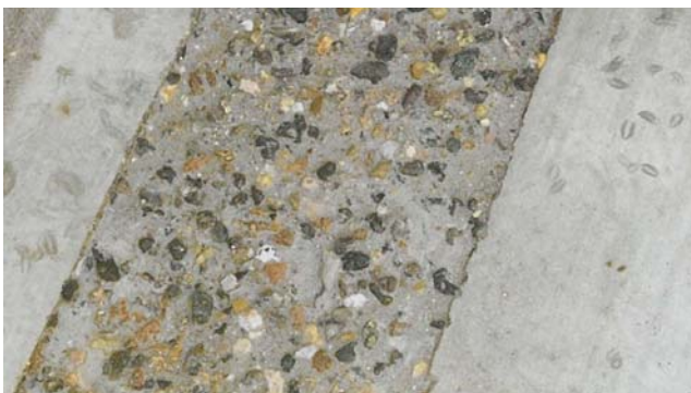
Bemærk profil og renhed af overfladen

Hele gulvet blev derefter behandlet på samme måde, og det har ikke siden givet problemer.